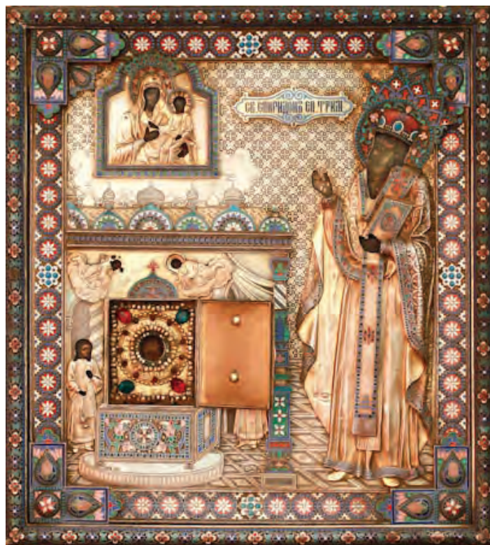
Икона святителя с частицей мощей (Храм Воскресения Словущего на Успенском Вражке. Москва, Брюсов переулок)