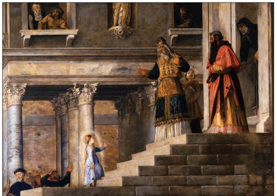
Введение во храм Пресвятой Богородицы (фрагмент). Вечеллио Тициан, 1534–1538. Венеция, Галерея Академии

У древних людей, или людей Библии, было особое наитие, духовное вдохновение. Ведь современный человек в некотором смысле является запрограммированным, он действует согласно внешним этикетным