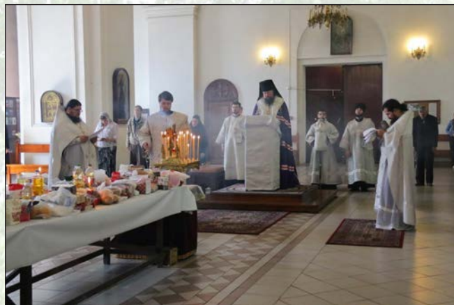
Панихида Троицкой родительской субботы

Круглый год почти каждую субботу в Церкви вспоминаются усопшие, потому что именно в этот день недели Господь наш Иисус Христос сошел Своей святой душой во ад, чтобы вывести оттуда души всех людей, ожидавших спасения. Обычно по субботам люди поминают своих кровных родных, отошедших в вечность. В Троицкую же родительскую субботу мы поминаем всех усопших православных христиан, в связи с чем эта суббота называется еще «Вселенская родительская суббота». Она предваряет собой праздник Троицы или Сошествия Святого Духа на апостолов, и это не случайно – ведь мы призваны помянуть и молиться не только за кровных, но и за духовных сродников, с которыми мы связаны Духом Святым.