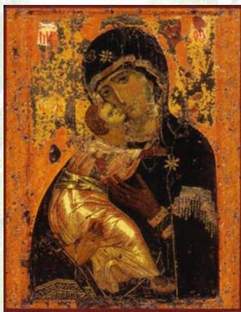
Владимирская икона Божией Матери. Государственная Третьяковская галерея. Москва