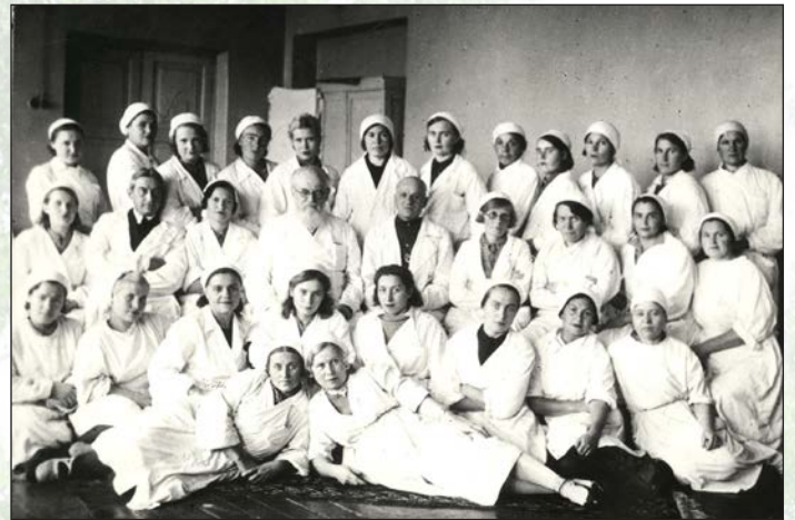
Святитель Лука с медперсоналом эвакогоспиталя. г. Красноярск. 1943 г.

В Подмоскowie преподобному Агапиту Печерскому посвящен первый после революции больничный храм, располагающийся в стенах Центральной клинической больницы восстановительного лечения Федерального медико-биологического агентства России. В храме есть икона с частицей святых мощей преподобного.