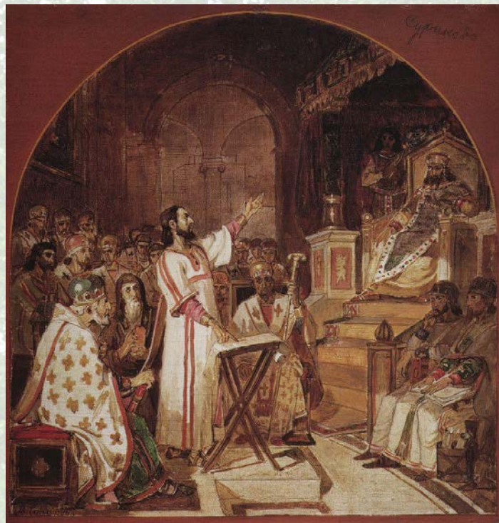
В.И. Суриков. Галерея живописи. Первый Вселенский Никейский Собор. 1876

В первое воскресенье после Вознесения празднуется память Первого Вселенского Собора. На нем в 325 году в городе Никее была опровергнута ересь Ария, учившего, что Иисус Христос не Бог, и провозглашена единосущность Бога Сына Богу Отцу. Ведь если Христос не Бог, то невозможно наше спасение и соединение с Богом, невозможно и Вознесение человеческой природы на Небо.