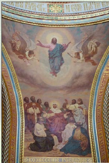
Вознесение Господне. Роспись Храма Христа Спасителя

В книге Деяний апостолов рассказывает о том, как Христос на 40-й день после Своего Воскресения в присутствии апостолов вознесся на Небо. Последняя глава Евангелия от Матфея доносит до нас слова, сказанные Господом перед Вознесением: «Я с Вами во все дни до скончания века. Аминь». Почему Христос говорит апостолам, что Он остается с ними и в то же самое время удаляется от них на Небо? Потому что теперь Его человеческая природа окончательно обожилась (соединилась с Богом) и стала обладать Божественными свойствами. Одно из Божественных свойств это вездиприсутствие, поэтому после Вознесения Иисус Христос пребывает с христианами всегда и везде, особенно в Своих Святых Тайнах, которых мы причащаемся на Литургии.