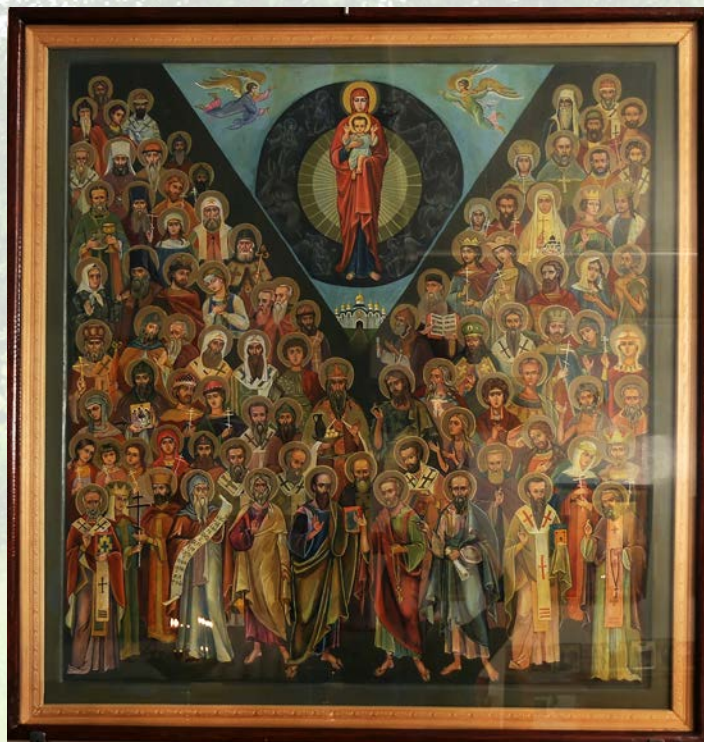
Икона всех святых. Больничный храм преподобного Агапита Печерского при ЦКБВЛ ФМБА РФ

В настоящий момент в церковном календаре можно найти около 5000 имен канонизированных святых. Но это не значит, что за всю историю христианства было только 5000 святых людей. По словам святителя Феофана Затворника, день Всех Святых установлен для того, чтобы помолиться и прославить тех святых, которые умерли в неизвестности, были замучены в неволе и погребены в неизвестных могилах, не будучи явлены земной Церкви.