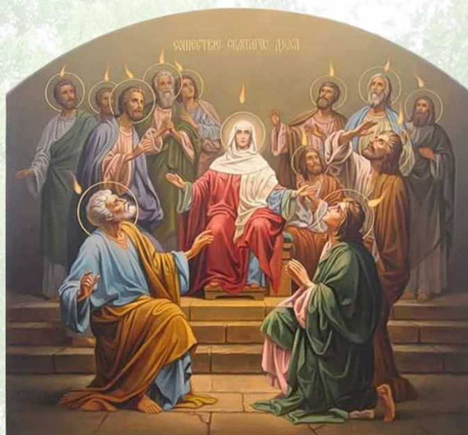
Сошествие Святого Духа на апостолов

В день Пятидесятницы Бог соединяет людей обратно в один народ посредством схождения Святого Духа на верующих во Христа. Из христиан, как из «живых камней», слагается здание Святой Церкви (в противоположность греховной Вавилонской башне). У всех верующих во Христа теперь как бы один «язык», на котором они говорят, язык Святого Духа.