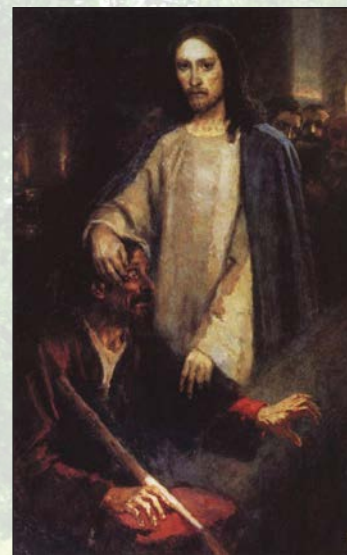
В.И. Суриков. Исцеление слепорожденного Иисусом Христом. 1889