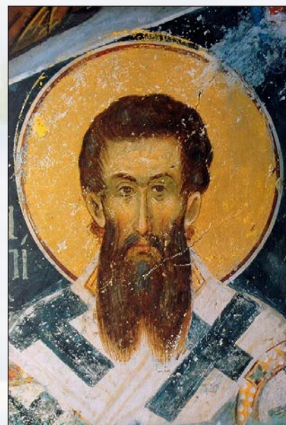
Святитель Григорий Палама. Фреска ок. 1371 г. Роспись церкви святых Бессребреников Афонского Ватопедского монастыря

Продолжателями молитвенного делания Паламы, созерцавшими нетварный свет, были преподобные Сергей Радонежский, Паисий Величковский, Серафим Саровский и многие другие святые. Нимбы, которые мы видим у святых на иконах, изображают тот самый нетварный свет, даруемый Господом.