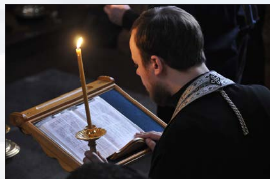
Чтение Великого покаянного канона

Преподобный Андрей Критский изобрёл и впервые ввёл в употребление при богослужении форму канона. Его авторству принадлежит около 70 канонов, среди которых каноны на главные церковные праздники – Пасху, Рождество Христово, Богоявление, Сретение, Благовещение, Преображение, Рождество Богородицы, а также каноны на дни памяти святых Николая Чудотворца, Григория Богослова, Иоанна Златоуста, великомученика Георгия и другие.