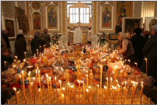
Панихида Вселенской родительской субботы

Перед воспоминанием о грядущем Втором пришествии Христа и Страшном Суде Церковь молится Богу за всех усопших православных христиан, чтобы Бог даровал им прощение грехов. Псалмопевец Давид говорит: «Мертвые не восхвалят Тя, Господи». Иначе говоря, умерший человек уже не может благодарить Бога, приносить жертвы, совершать добрые дела, не может каяться в грехах. Такая возможность есть у нас, живущих на земле. Поэтому христиане в день Вселенской родительской субботы и в родительские субботы приносят в храм продукты и пожертвования за усопших, пишут записки об упокоении их душ для поминовения за Литургией и на панихиде, посещают могилы предков, подают милостыню нуждающимся и совершают добрые дела в память усопших родителей и предков. Но самое главное – каждый христианин старается в этот день исповедаться и причаститься Святых Христовых Тайн, чтобы дальше жить согласно заповедям Того, в Чьих руках души и живых, и усопших, ходатайствуя перед Богом за своих умерших родных. Особенно же Церковь предлагает молиться за усопших в период Великого поста, когда мы особенно стараемся угодить Богу и исполнить Его святую волю.