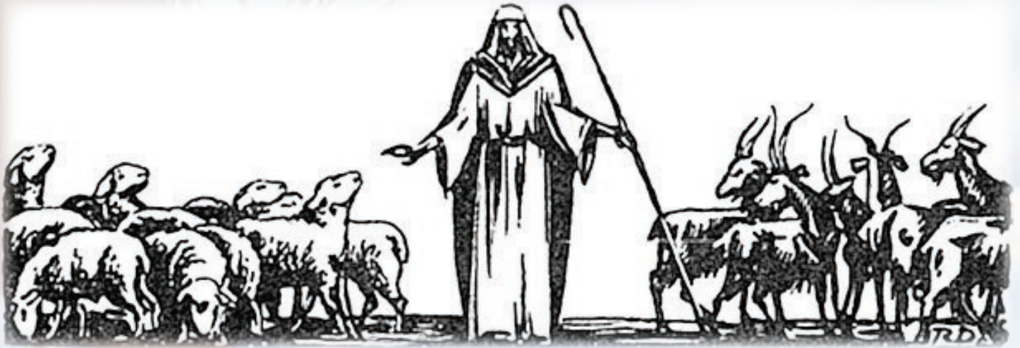
Овцы и козлы

В Евангелии есть точное описание того, как будет происходить Страшный Суд. Тогда скажет Царь тем, которые по правую сторону Его: приидите, благословенные Отца Моего, наследуйте Царство, уготованное вам от создания мира. Господь не говорит «примите Царство», но «наследуйте» , как свое собственное, принадлежащее от вечности. Далее Господь поясняет, на каком основании все это принадлежит людям: ибо алкал Я, и вы дали Мне есть; жаждал, и вы напоили Меня; был странником, и вы приняли Меня; был наг, и вы одели Меня; был болен, и вы посетили Меня; в темнице был, и вы пришли ко Мне.