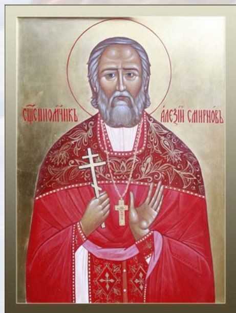
Священномученик Алексей Смирнов

Священномученик Алексей Смирнов родился и вырос в поселке Голубое Звенигородского уезда Московской губернии. Сейчас этот поселок называется Голубое (входит в состав городского округа Солнечногорск Московской области). Дом, где родился, вырос священномученик Алексей, и храм, в котором он помогал своему отцу в детстве, находились недалеко от того места, где сейчас находится Центральная клиническая больница восстановительного лечения ФМБА РФ и наш больничный храм.