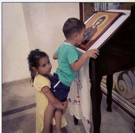
Дети прикладываются к иконе