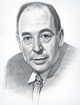
К. С. Льюис

В кинематографе на тему различия рая и ада тоже есть несколько произведений. Наиболее яркое из них фильм Винсента Уорда «Куда приводят мечты», снятый по одноименной книге Ричарда Мэтисона.