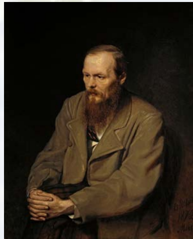
В. Перов. Портрет Ф.М.Достоевского (1872)

Тема личного выбора между раем и адом, который делает человек, интересовала многих мыслителей и философов. В частности, великий русский писатель Федор Михайлович Достоевский много