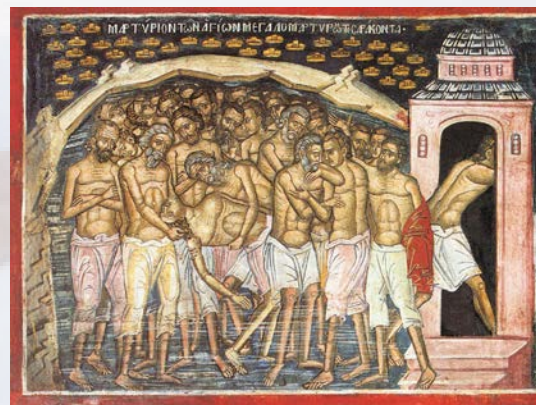
Сорок мучеников Севастийских. Фреска монастыря Дионисиат, Афон, 1547 г.

40 мучеников состояли на службе в 12-м Молниеносном Легионе (лат. Legio XII Fulminata ) и были мужественными воинами, не раз принимавшими участие в военных походах и битвах. За веру во Христа воинов подвергли пытке – ночью бросили в ледяные воды Севастийского озера. Один из сорока мучеников не выдержал пытки и сдался на уговоры отречься от веры. Палач по имени Аглаий увидел в воздухе 39 мученических венцов, опускающихся на воинов, и еще один венец, остающийся в небе. Он понял, что кому-то предстоит восполнить число избранных, объявил себя христианином, вошел в воды озера и принял этот мученический венец. Как правило, день памяти 40 мучеников выпадает на Великий Пост. В этот день христиане вспоминают, что надо быть мужественными и, будучи искушаемы, не сдаваться.