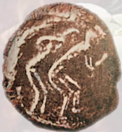
Адам и Ева, убитые горем, покидают рай. Месопотамская печать, IV тыс. до Р. Х.

В этот день мы просим прощения друг у друга, так как благодаря Крестной жертве Христа потерянный рай стал достижим через раскаяние, прощение и примирение.