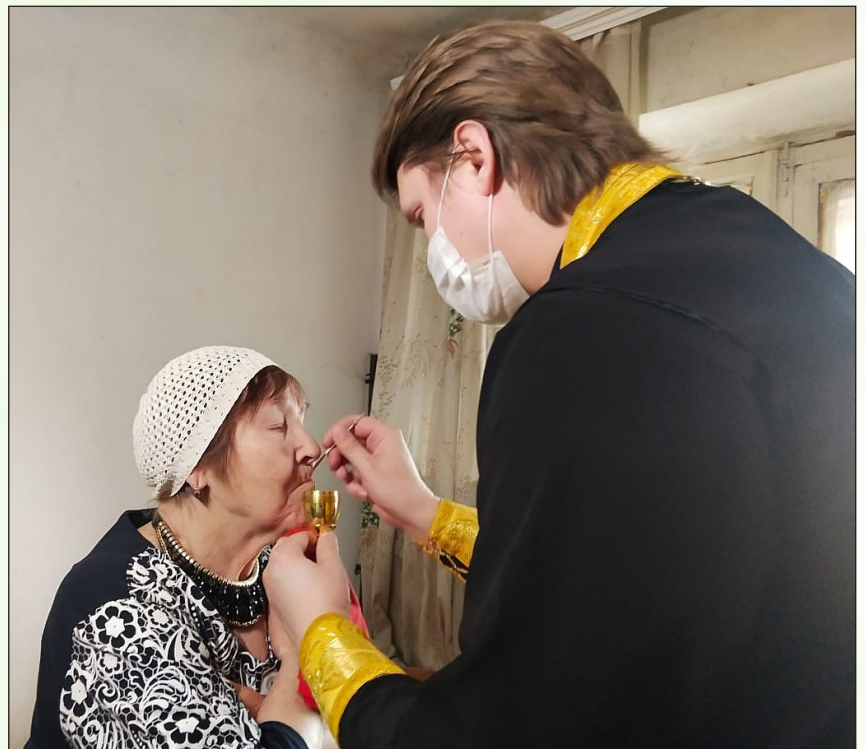
Причастие на дому.

Адмирал Ушаков ставил патрули на въездах и выездах, всем приказывал оставаться дома, а всех больных изолировал. Болезнь была побеждена, а адмирал награжден орденом Святого Владимира. И мы с вами видим не просто понимание со стороны Церкви его действий как руководителя. Этот глубоко верующий человек стал святым молитвенником за нас у престола Божия!