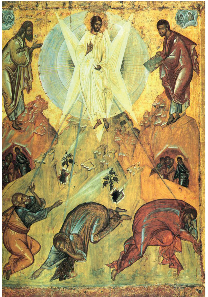
Феофан Грек. Преображение Господне. XIV век. Государственная Третьяковская галерея.

В праздник Преображения Церковь освящает виноград и другие фрукты. Народ приносит в храм плоды земные и начатки урожая, и священники, прежде чем окропить яблоки, груши, виноград, как это было принято на Пелопоннесе и в Херсонесе, читают особую молитву для верных, прося Господа Бога просветить их сердца лучами богопознания, чтобы они