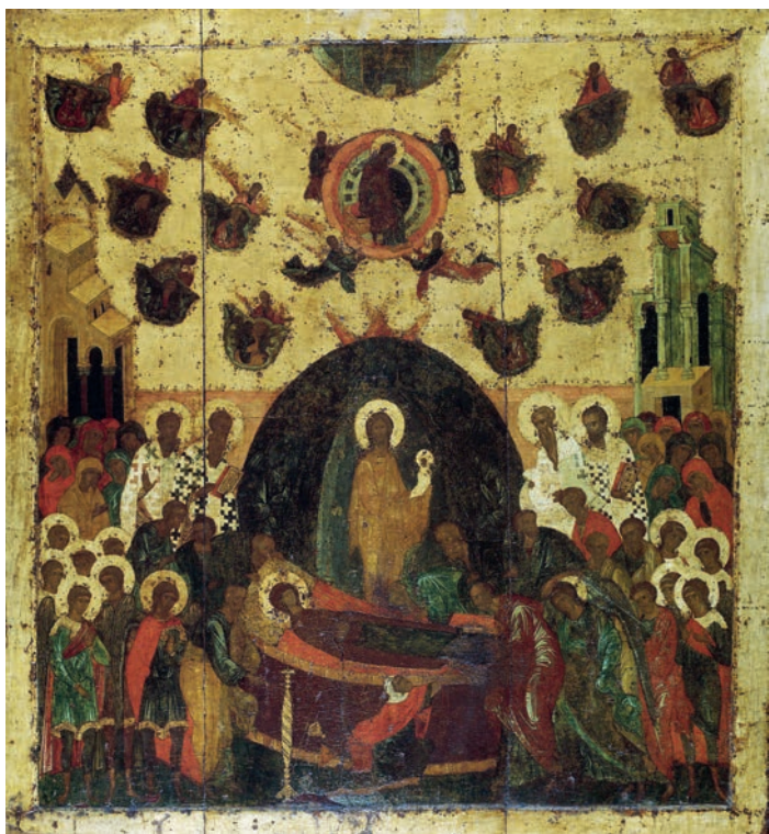
Икона из Успенского Собора Московского Кремля

с радостью о Святом Духе, с высшей мудростью: он не нарушается никакими оскорблениями, лишениями имущества, страданиями.