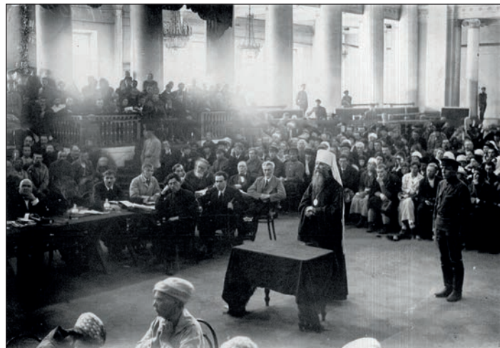
Митрополит Вениамин на допросе

Митрополит подробно рассказывает историю возникновения писем в связи с изданием декрета и желанием безболезненного проведения его в жизнь. Вопрос об изъятии для церкви и ее верующих – большой вопрос, к разрешению которого нужно было