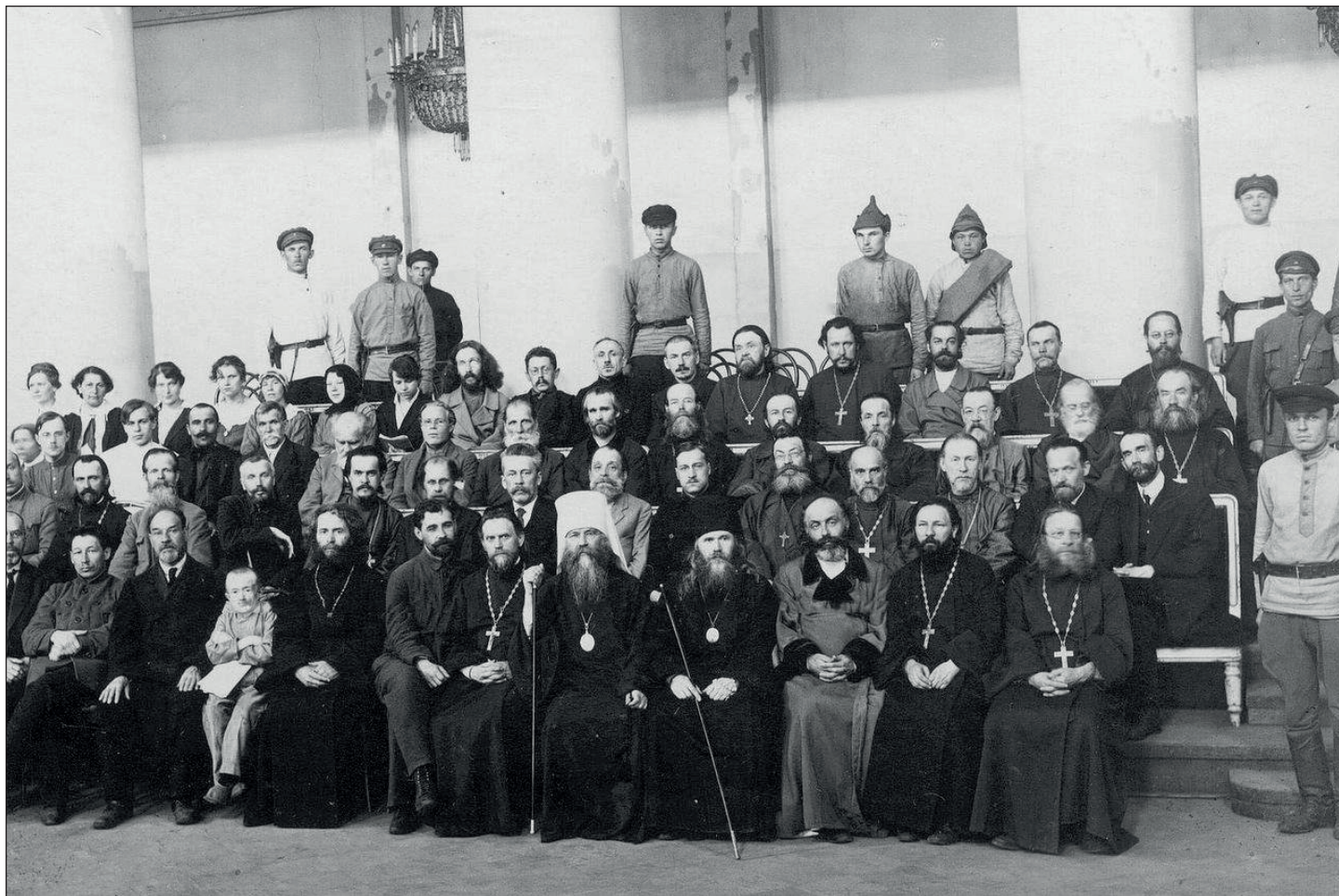
Митрополит Вениамин в зале суда

– Не знаю. Знаю, что одно письмо было оглашено на лекции священником Забиновским, и слышал, что на оглашение этого письма он получил словесное разрешение при переговорах в Смольном.