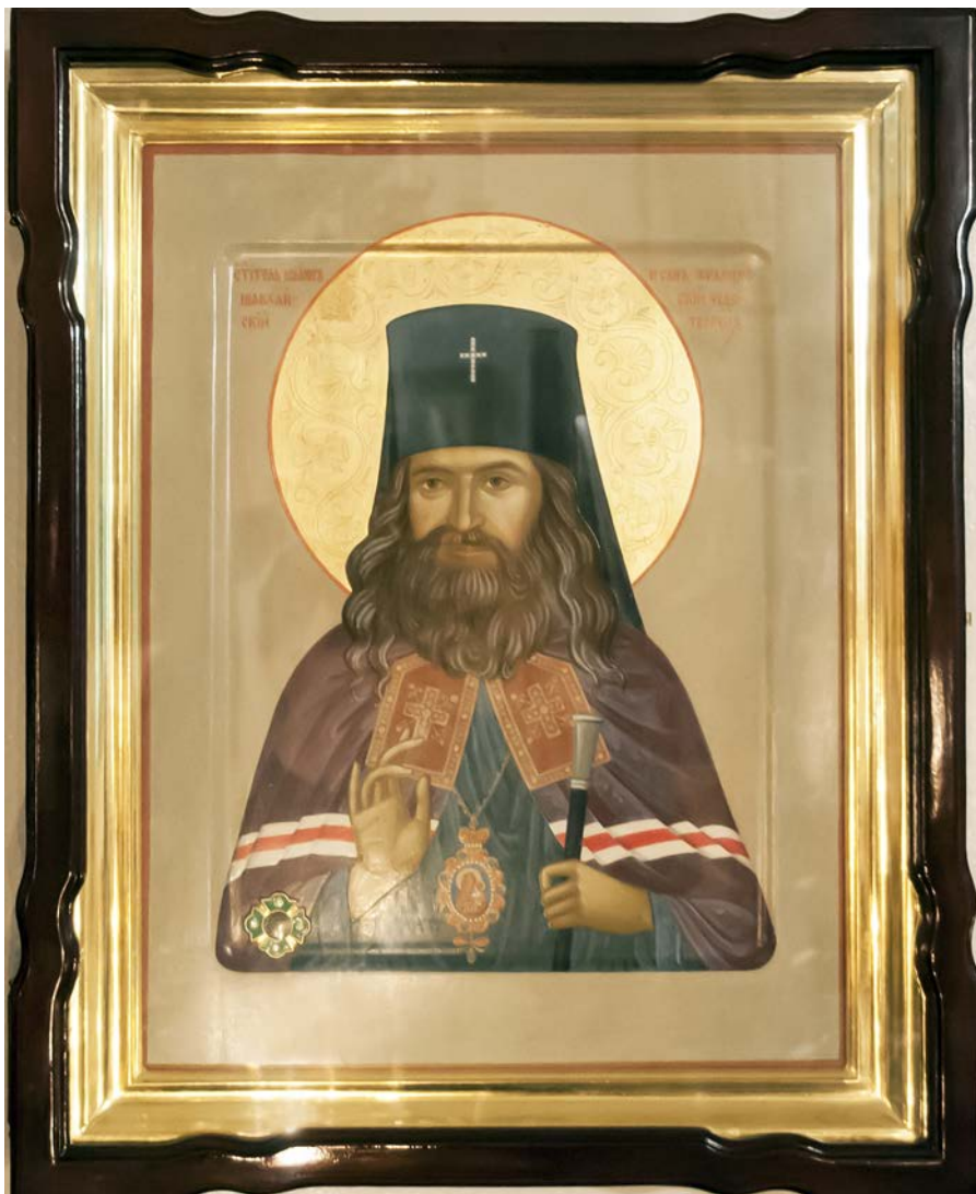
Икона святителя Иоанна Шанхайского с частицей мощей, находящаяся в больничном храме преподобного Агапита Печерского

1 июля, накануне дня памяти святителя Иоанна, архиепископа Шанхайского и Сан-Францисского, в 16:00 перед иконой с его мощами в больничном храме будет отслужен молебен о здравии с акафистом. В 6:00 2 июля, в день памяти святителя, будет совершена Божественная литургия. Святителе Иоанне, моли Бога о нас!