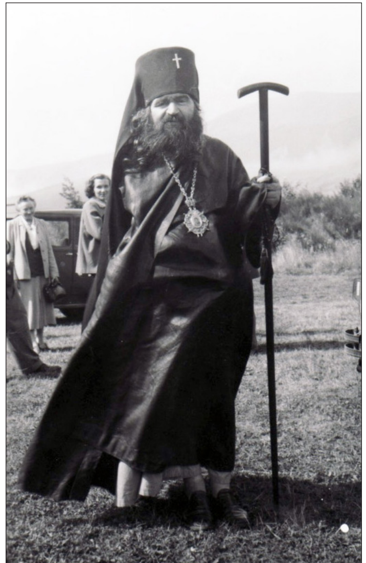
Святитель Иоанн в Сан-Франциско. На фотографии видно, что ботинки он надел на босу ногу