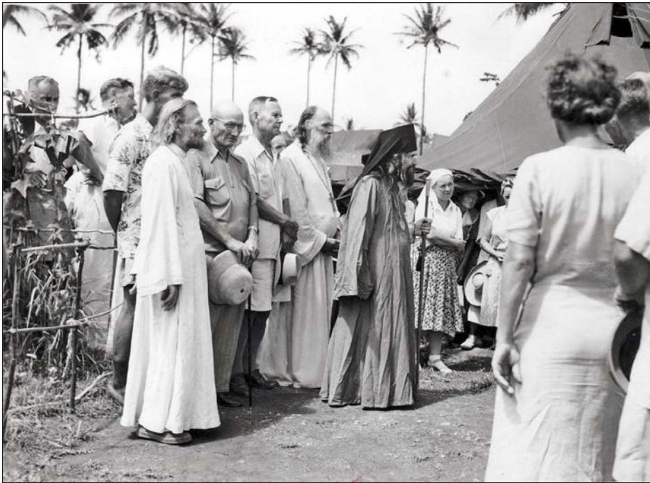
Святитель Иоанн с прихожанами перед входом в палаточный храм на острове Тубаба

ваш лагерь каждую ночь со всех четырех сторон». Когда же лагерь был эвакуирован, страшный тайфун обрушился на остров и полностью уничтожил все строения.