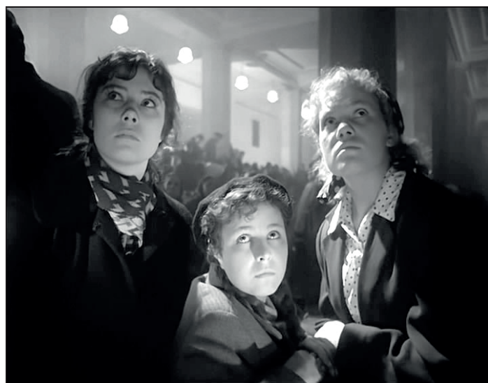
«Летят журавли». 1957. Роль Даши (на кадре справа)