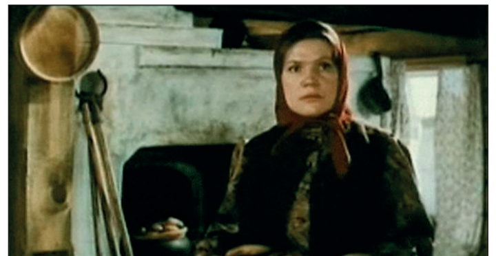
«Тени исчезают в полдень». 1971. Роль Мироновны

– Мне кажется, сейчас много верующих. Я совершенно в этом не сомневаюсь.