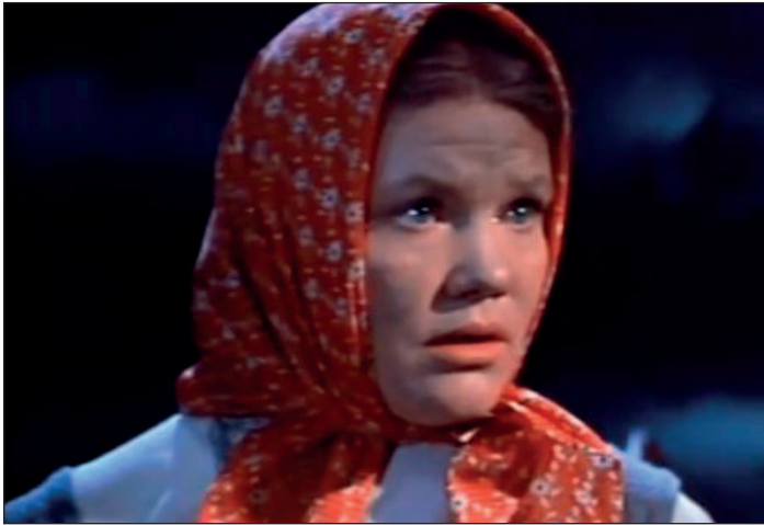
«Варвара-краса, длинная коса». 1969 Роль рыбацки

– В те времена священников было мало, а людей много, и священник не успевал всех исповедовать.