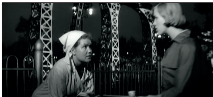
«Я шагаю по Москве». 1963 Роль продавщицы мороженого

– Не знаю. Я помню, что бежала креститься. Раз братьев взяли креститься. А что это такое, я не знала.