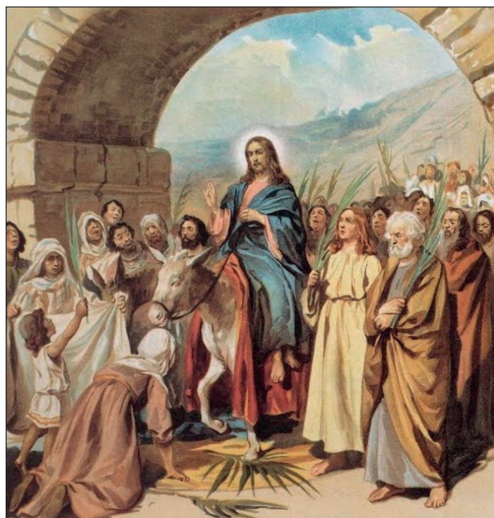
Клавдий Васильевич Лебедев. Вход Господень в Иерусалим

Православные христиане на этот праздник тоже приходят в храм с ветвями в руках. Правда, у нас в России это не пальмы, а веточки вербы. Но суть этого символа – та же, что и две тысячи лет назад в Иерусалиме: ветвями мы встречаем нашего Господа, вступающего на Свой Крестный Путь. Только современные христиане, в отличие от жителей древнего Иерусалима, абсолютно точно знают, Кого они приветствуют в этот день и что Ему предстоит вместо царственных почестей. Об этом прекрасно сказал в одной из проповедей митрополит Суражский Антоний: «Народ Израилев от Него ожидал, что, вступая в Иерусалим, Он возьмет в свои руки власть земную; что Он станет ожидаемым Мессией, Который освободит Израильский народ от врагов, что кончена будет оккупация, что побеждены будут противники, отмщено будет всем... А вместо этого Христос вступает в Священный Град тихо, восходя к Своей смерти... Народные вожди, которые надеялись на Него, поворачивают весь народ против Него; Он их во всем разочаровал: Он не ожидаемый, Он не тот, на которого надеялись. И Христос идет к смерти...» В праздник Входа Господня в Иерусалим верующие тоже, подобно евангельским иудеям, приветствуют Спасителя вайями. Но каждый, взявший их в руки, должен честно спросить себя, готов ли он принять Христа не как могущественного земного царя, а как Владыку Царства небесного, Царства жертвенной любви и служения? Вот к чему призывает Церковь в эту радостно-печальную неделю с непривычным для русского слуха названием.