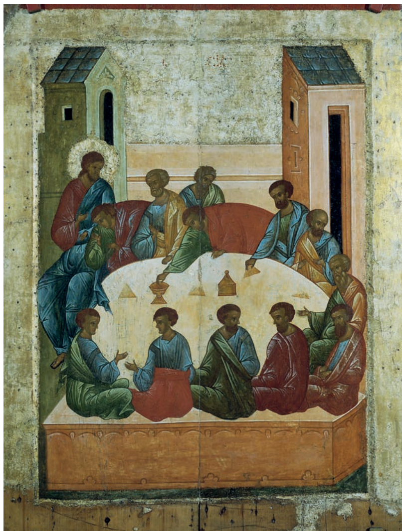
Икона «Тайная вечеря». 1425–1427 гг.

Апостол Павел говорит: « всякий раз, когда вы едите Хлеб сей и пьете Чашу сию, вы смерть Господню возвещаете, пока Он не придет » (1 Кор. 11, 26). Кровью жертвенных животных скреплялся Ветхий Завет – союз Бога и древнего израильского народа.