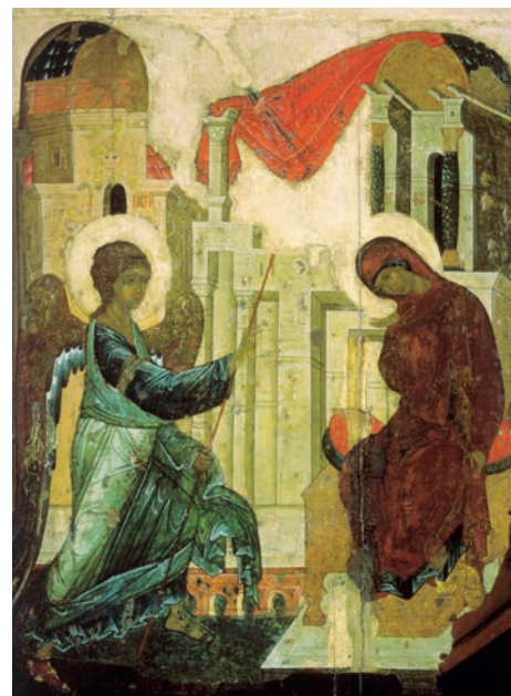
Икона «Благовещение». 1425–1427 гг. Мастерская Андрея Рублева. Троицкий собор Свято-Троицкой Сергиевой Лавры

Праздник Благовещения напоминает о великой любви Бога к людям и о том, что Сын Божий стал человеком для того, чтобы нас сделать участниками Своей Божественной природы. Этот праздник призывает нас подражать Пречистой Деве в Ее подвиге чистоты и целомудрия