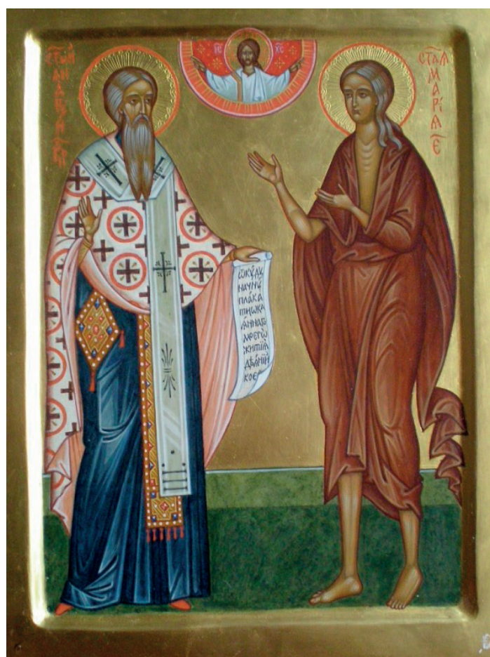
Икона преподобных Андрея Критского и Марии Египетской.

В притворе храма висела икона Богородицы. Мария никогда раньше не молилась, но теперь перед иконой она обратилась к Божией Матери и поклялась изменить свою жизнь. После этой молитвы она