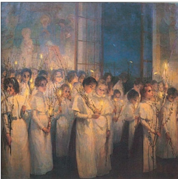
Серафима Иасоновна Блонская. Девочки. Вербное воскресенье. 1900