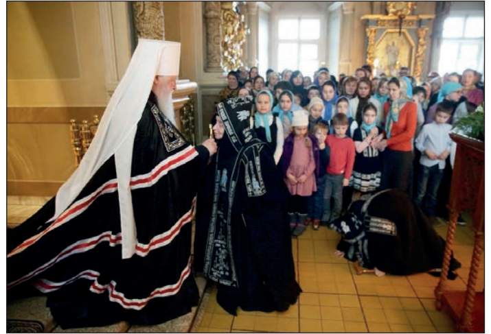
Великая вечерня с чином прощения в Новодевичьем монастыре

Чин прощения совершается, чтобы быть прощённым и примиренным со всеми и – благодаря этому – с Богом. Нужно простить тех, кто нас обидел, и попросить прощения у тех, кого мы обидели, может быть и нечаянно. Поэтому прощения просят не только в храме, но и дома, и даже у друзей. Можно так сказать: «Прости меня, а я тебя прощаю – и Бог простит».