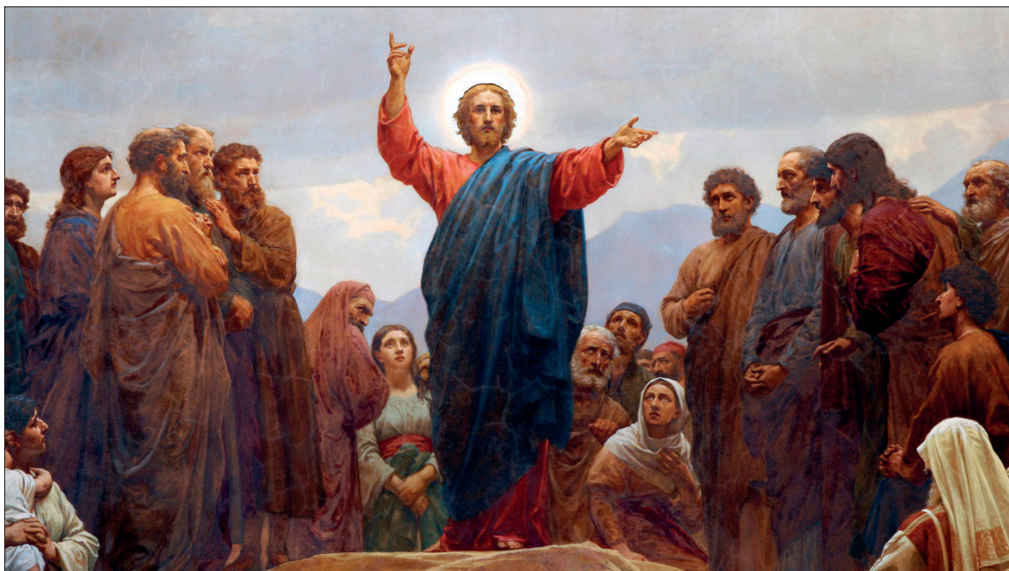
Хенрик Олрик (1830—1890). Нагорная проповедь, фреска (фрагмент). Алтарь церкви Св. Матфея, Копенгаген

Использованы материалы: Троицкие листки. № 801-1050.