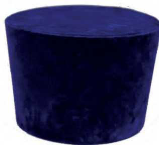
Камилавка – награда