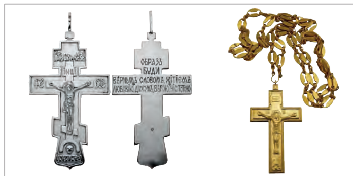
Восьмиконечный крест (слева) священники носят со дня хиротонии. Четырехконечный крест (справа) золотого цвета – награда.

Право ношения наперсного креста золотого цвета. Награждение производится не ранее чем через четыре года после награждения правом ношения камилавки (для иеромонахов и священноиноков –