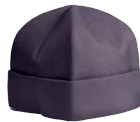
Скуфья черного цвета – повседневный головной убор православного духовенства

во время богослужения. Символизирует «меч духовный, который есть Слово Божие» (Еф. 6, 17). Исторически набедренник служил для защиты ноги от висящего на поясе меча.