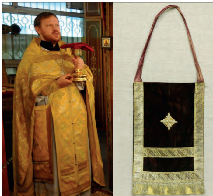
Набедренник надевают под ризу на левое плечо и располагают у правого бедра

Набедренник имеет вид матерчатого продолговатого прямоугольника (плата), в центре которого изображён крест. Набедренник надевается под фелюнь на левое плечо и носится у бедра с правой стороны