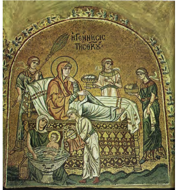
Мозаика церкви Успения в Дафни. Около 1100 г. Греция

После этого Анна зачала. Как пишет Протоэвангелие Иакова, «прошли положенные ей месяцы, и Анна в девятый месяц родила». Праведники дали обет посвятить своего ребенка Богу и отдали дочь Марию в Иерусалимский храм, где она служила до совершеннолетия.