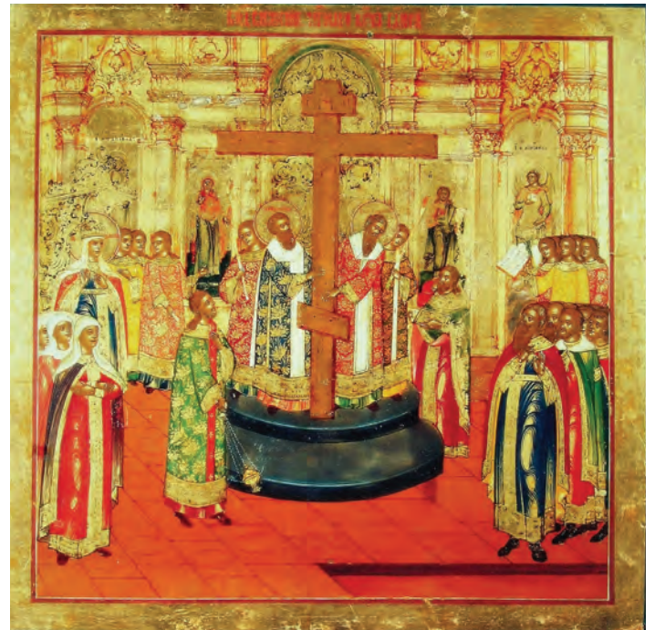
Воздвижение Креста Господня. Невьянская икона. 1830-1840 гг.

узнать, который из трех крестов есть Крест Спасителя. Иерусалимский патриарх (епископ) Макарий и царица Елена твердо верили и надеялись, что Бог укажет святой Крест Спасителя.