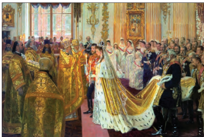
«Бракосочетание Николая II и великой княгини Александры Федоровны» (1895). Лауритс Регнер Туксен. Государственный Эрмитаж. Санкт-Петербург

Существует благочестивая традиция для молодоженов – исповедаться и причаститься на литургии в день венчания. Этот обычай связан с тем, что в древности благословение супружеской пары происходило на литургии. Отдельные элементы литургии до сих пор присутствуют в чине венчания: пение «Отче наш», общая чаша, из которой пьют супруги... Исповедь и причастие перед венчанием имеют большое значение: рождается новая семья, у молодоженов – новый этап жизни, и начать его надо обновившись, очистившись в Таинствах от греховной скверны. Если никак не получается причаститься в день венчания, сделать это надо накануне.