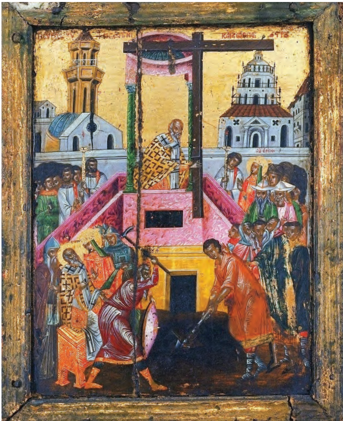
Обретение Креста. Афон, монастырь Пантократор. XVII в.

Когда откопали пещеру, то нашли в ней три креста и отдельно лежащую от них дощечку с надписью: «Иисус Назорей, Царь Иудейский». Нужно было