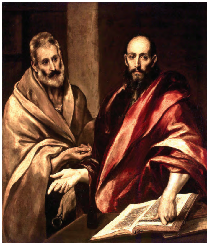
Апостолы Петр и Павел (1587-1592). Эль Греко. Санкт-Петербург. Эрмитаж