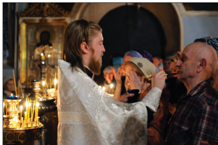
Соборование в Спасском храме пос. Андреевка