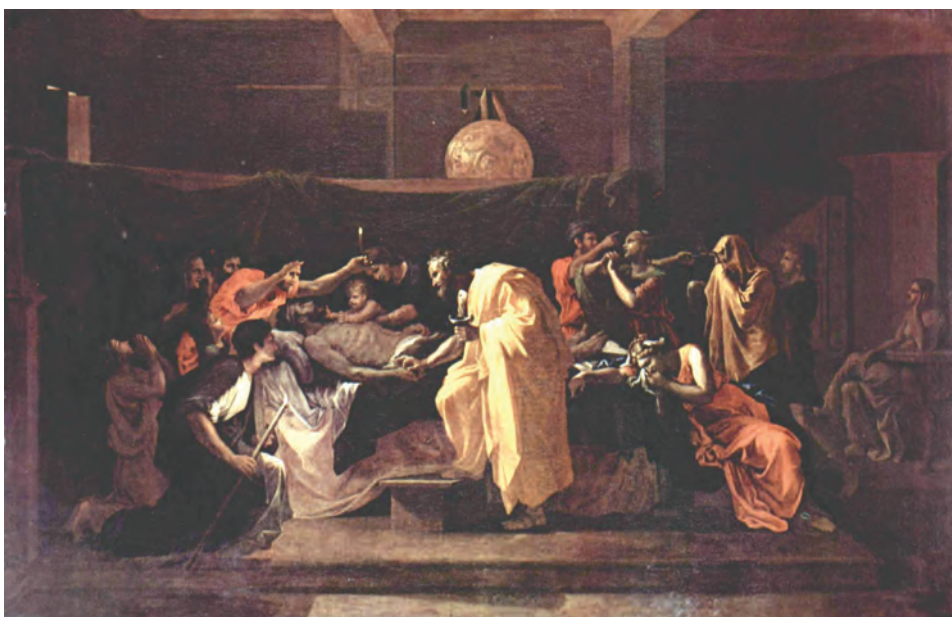
Николя Пуссен. Соборование (1636–1639). Национальная галерея Шотландии

Совершение над болящим Таинства елеосвящения как средства духовного врачевания не отменяет употребления естественных средств, данных Господом для врачевания наших болезней. И после соборования о болящем необходимо иметь