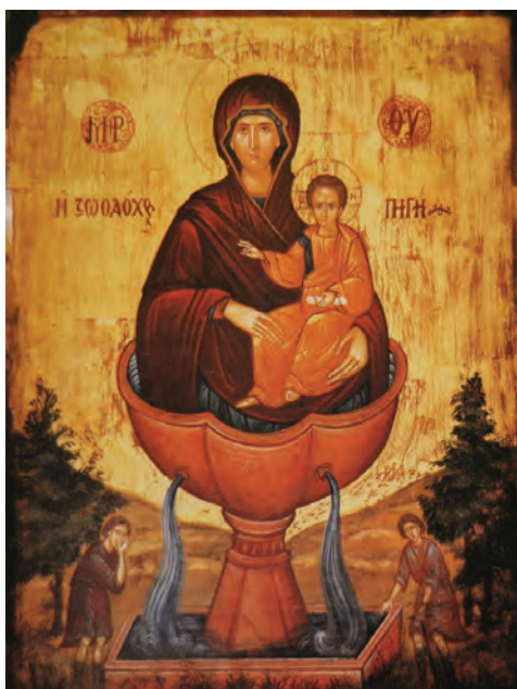
Икона Божией Матери «Живоносный источник»

Врач, как принципиальный участник жизни человека с момента его рождения до смерти, сегодня имеет возможность свободно обсуждать фундаментальные проблемы человеческой жизни. Определить отношение к ним ему поможет и моральная традиция отечественного врачевания, и принципы Всемирной Медицинской Ассоциации, которая в 1983 году приняла специальную декларацию о медицинских абортах.