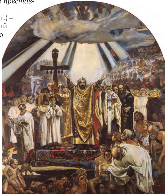
Крещение Руси. В. М. Васнецов

Святейший Патриарх Кирилл в своем послании в связи с празднованием подчеркнул: «В нынешнем году вся Церковь Русская, а вместе с ней и весь православный мир отмечают тысячелетие преставления святого равноапостольного великого князя Владимира. Благодаря этому святому правителю была основана Церковь Русская, которая вот уже более тысячи лет несет людям слово жизни, любви и мира и в которой мы, как и наши предки, обретаем Царство Небесное».