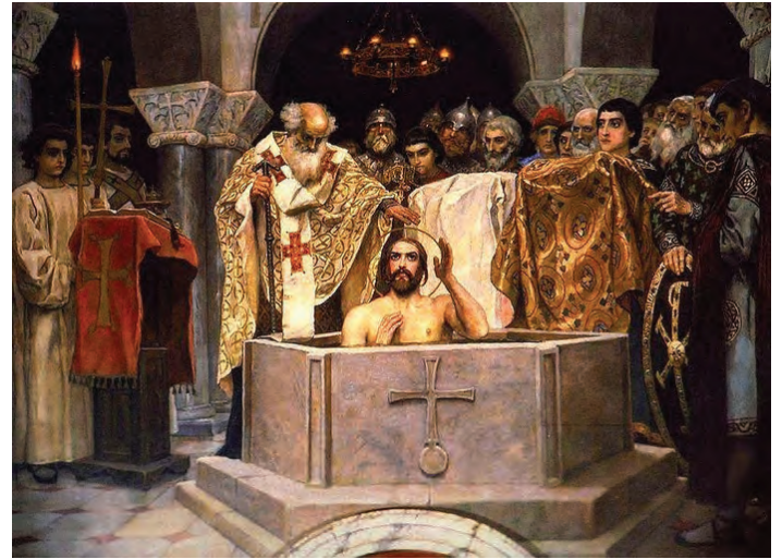
Крещение Святого князя Владимира. В.М. Васнецов

пытаемся возобновить вялые попытки то с Нового года, то с понедельника.